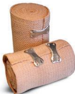
شکل ۳ - باند کشی

باندی که از الیاف طبیعی تولید شده و بافت کشی دارد، اکسیژن به راحتی به بافت زیری آن می رسد و به منظور محافظت محل آسیب دیده و کاهش ادم، حفاظت و ثابت نگه داشتن پانسمان و موارد بازتوانی و صدمات کاربرد دارد. این باند بیشتر در اندام های انتهایی جهت جلوگیری از ادم و حمایت وریدهای واریسی کاربرد دارد (به شکل ۳ مراجعه شود).