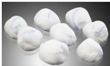
شکل ۲- اسپانج جراحی

اسپانج های جراحی، اسپانج یا پد مخصوصی است که برای جذب مایع ناحیه عمل جراحی استفاده می شود. این اسپانج ها قابل تشخیص با اشعه ایکس می باشند. تمام گازهای استریل داخل اتاق عمل بایستی از نوع خط دار باشند.