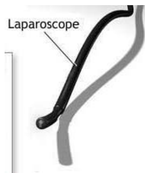
شکل ۴- لاپاراسکوپ

نوعی دستگاه درون بین (اندوسکوپ) که دارای یک لوله روشن کننده است که در دیواره شکم وارد می شود و برای بررسی حفره پریتونئ، به کار می رود.