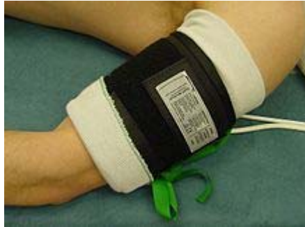
شکل ۵- تورنیکت جراحی