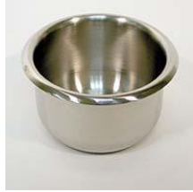
شکل ۱- گلی پات