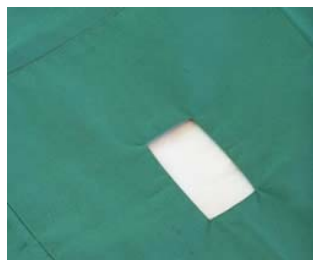
شکل ۱- شان های سوراخ دار (پرفوره)